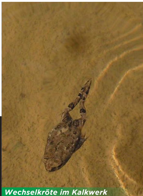
Wechselkröte im Kalkwerk