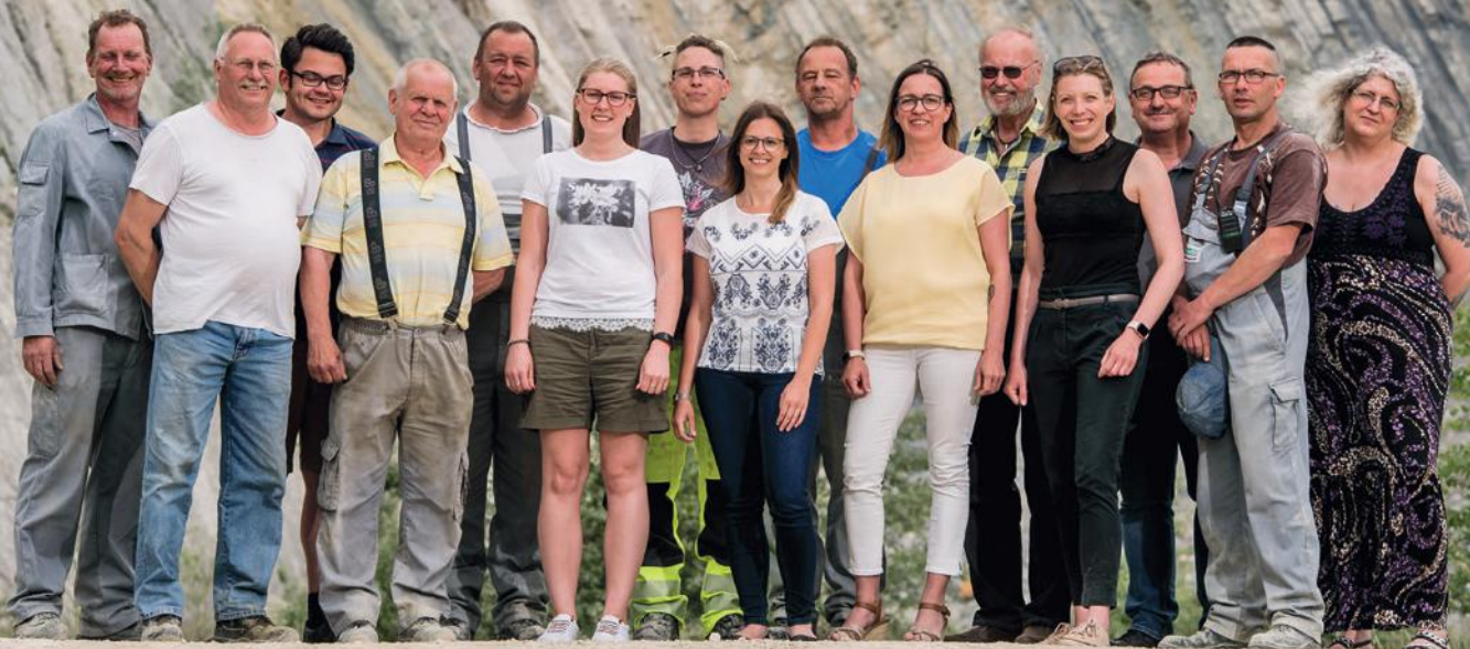
Mitarbeiter/-innen des Kalkwerk Oker und der Verwaltung