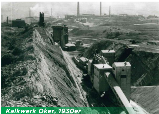
Kalkwerk Oker, 1930er