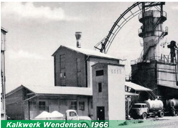
Kalkwerk Wendessen, 1966