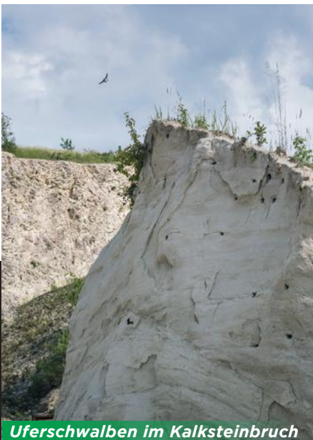
Uferschwalben im Kalksteinbruch

Auf den Bildern sieht man, wie gut ein Nebeneinander von Rohstoffgewinnung und Naturschutz funktioniert.