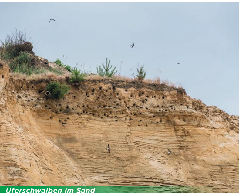
Uferschwalben im Sand