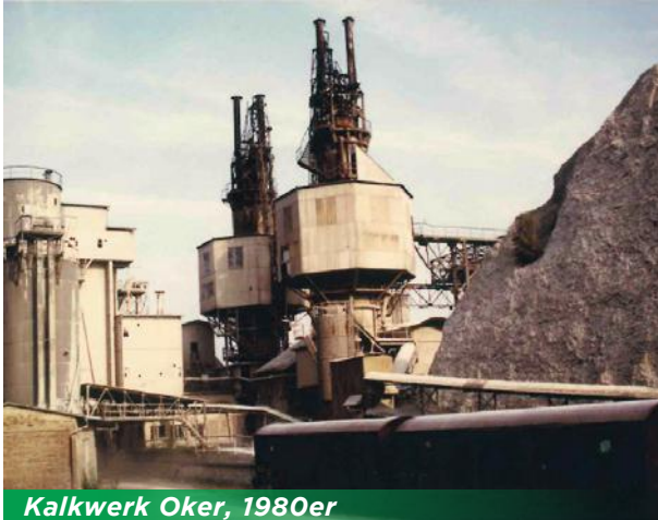
Kalkwerk Oker, 1980er