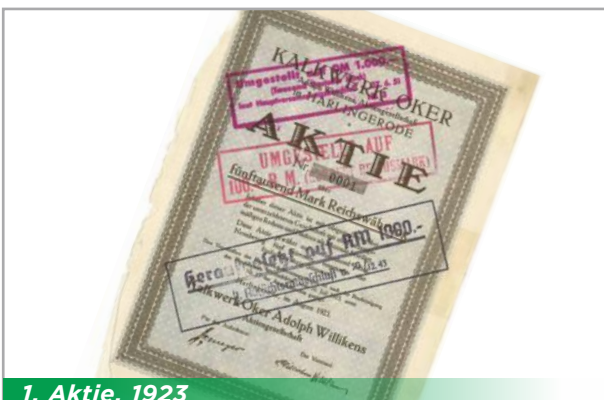
1. Aktie, 1923